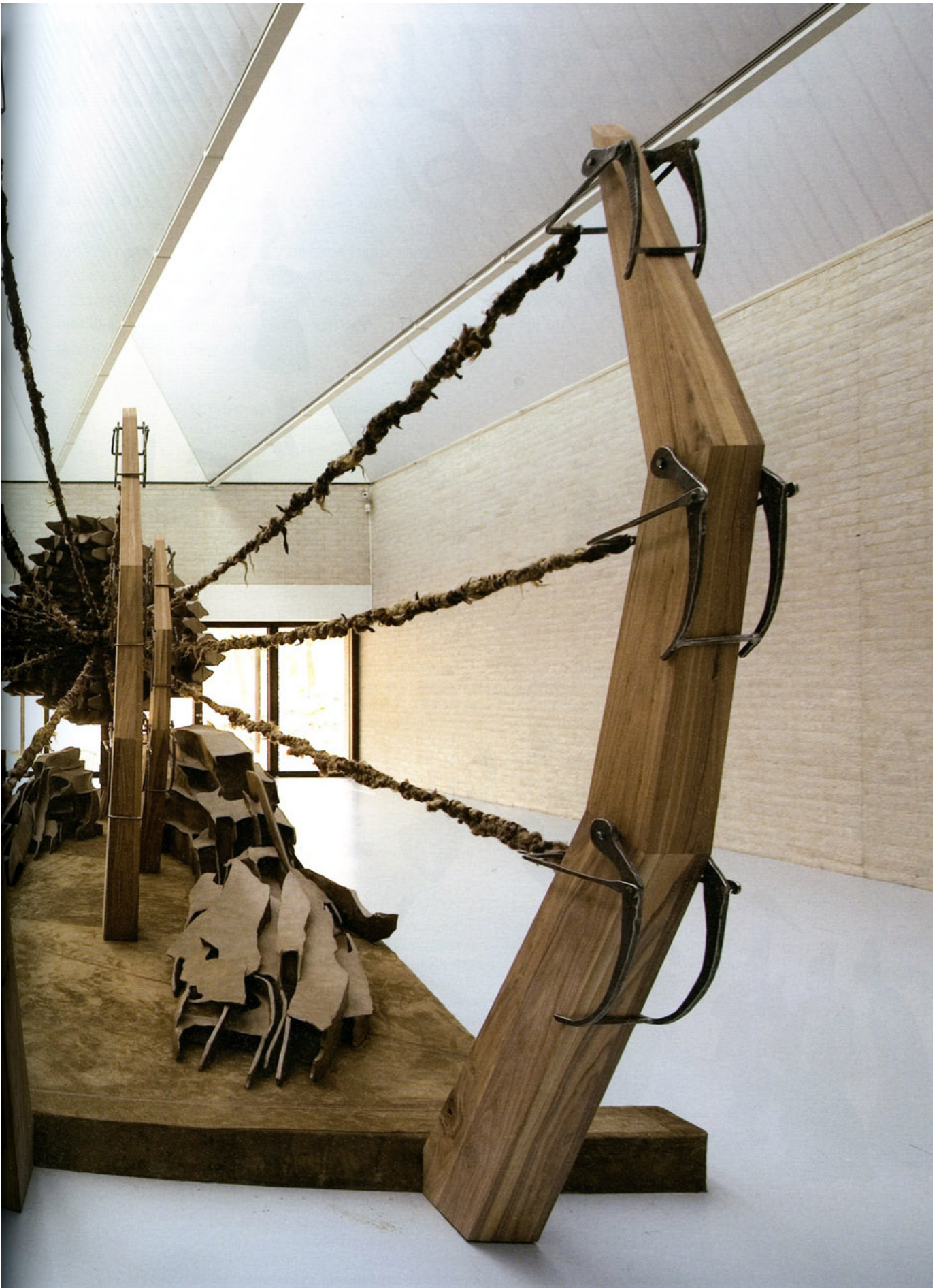
Alchemist Aladogan in Boijmans Van Beuningen. Een nieuwe wereld?, Machteld Leij, Kunstbeeld, 2009, no.11