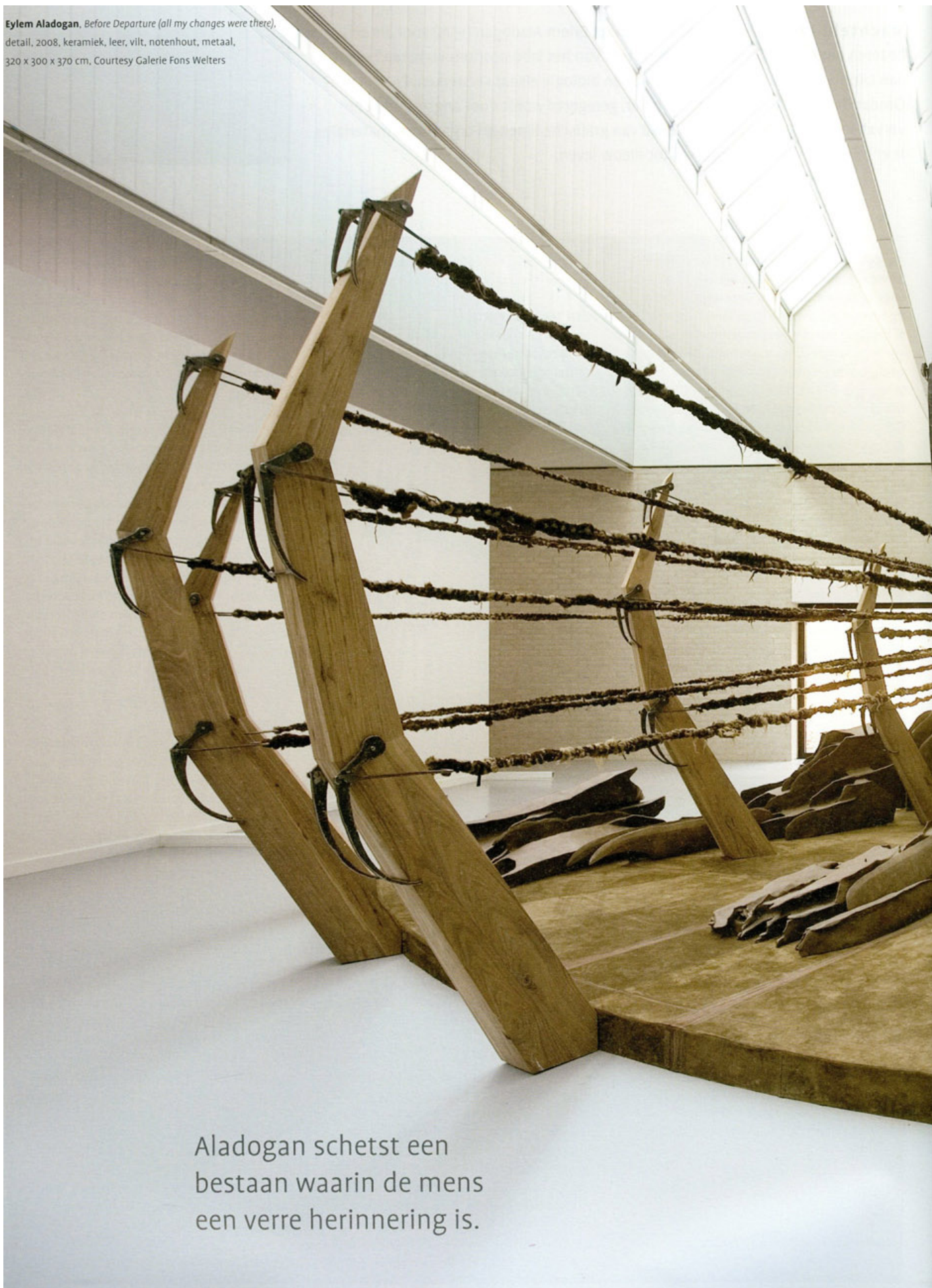
Eylem Aladogan , Before Departure (all my changes were there) , detail, 2008, keramiek, leer, vilt, notenhout, metaal, 320 x 300 x 370 cm.

Aladogan schetst een bestaan waarin de mens een verre herinnering is.